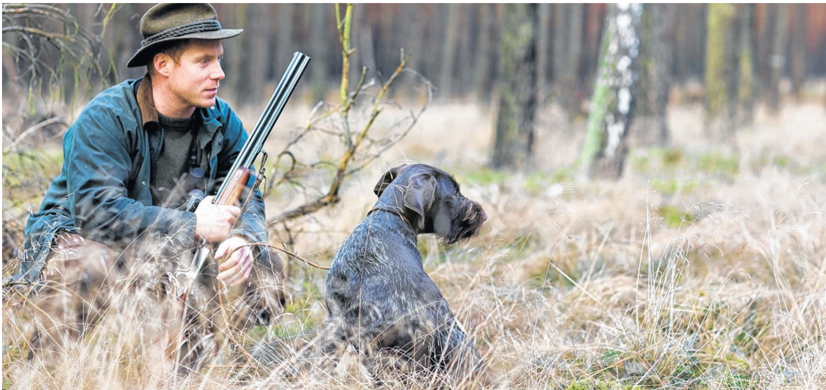
Es gibt bereits Jäger, die bleifreie Munition verwenden. Ob alle im Land dazu verpflichtet werden, ist bislang noch nicht entschieden.